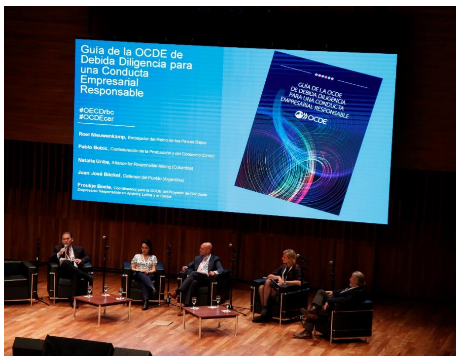
Presentación de la Guía de Debita Diligencia en Buenos Aires, Argentina

El PNCA ofrece una plataforma de mediación y conciliación para ayudar a resolver casos (referidos como "instancias específicas") relacionados con el incumplimiento de las Directrices de la OCDE para empresas multinacionales por parte de las empresas. Cualquier individuo u organización con